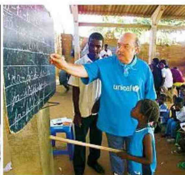
ROSSELLA E LINO PER I PIÙ PICCOLI Rossella Brescia, 49, è testimonial di molti enti cui l'Ail e WeWorld, mentre Lino Banfi, 84, è ambasciatore dell'Unicef nel mondo e ha partecipato a tanti viaggi in Africa.