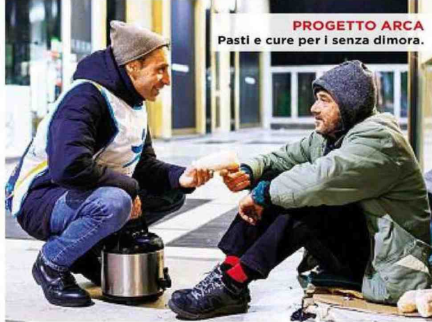
PROGETTO ARCA Pasti e cure per i senza dimora.

Tra i malati che più hanno subito la pandemia ci sono quelli che soffrono di fibrosi cistica, una malattia che blocca i polmoni fino all'impossibilità di re-