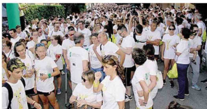
In quattromila alla Marafibrositona del 2019 SELVA