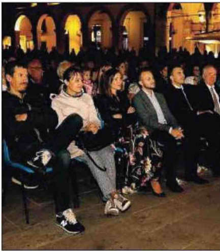
Evento Baseball night serata in piazza Vittorio