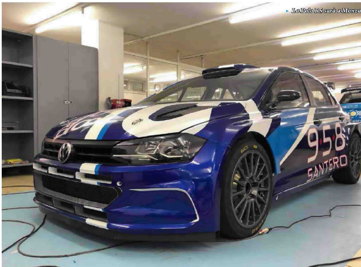
► La Polo RS sarà a Monza